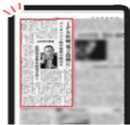
日経電子版 紙面ビューアー